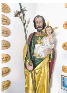
Statue des hl. Josef im Vorraum der Pfarrkirche St. Josef, Unteriberg, wo der hl. Josef besonders verehrt wird.