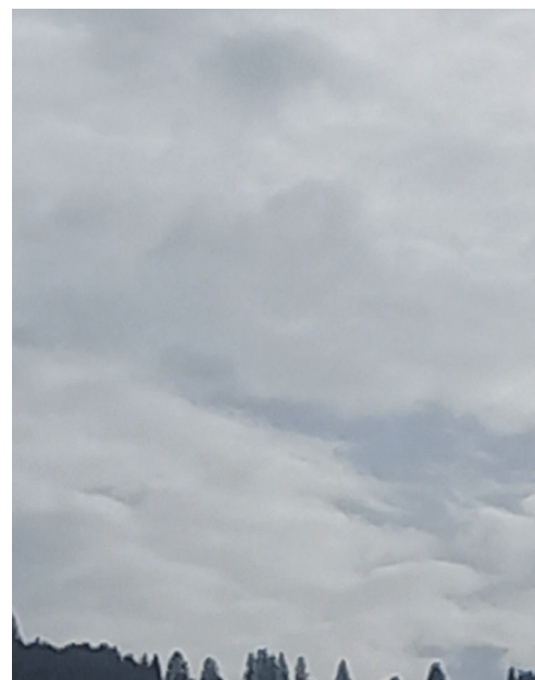
Das Wetter von meinem Büro aus.