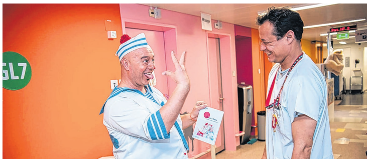
Spitalclown Dada mit einem Arzt – die enge Zusammenarbeit zwischen Clowns, Ärzten und Pflege erleichtert allen den Alltag.