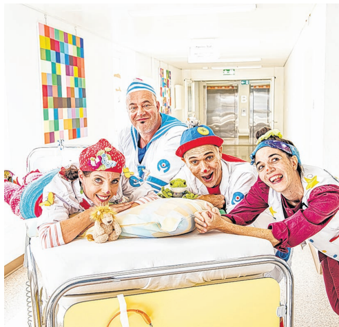
Die vier Spitalclowns Flippa, Dada, Knopf und Giga.

Thomas Wermelinger besucht uns in den Gottesdiensten vom 9. und 10. September und stellt uns die Stiftung vor.